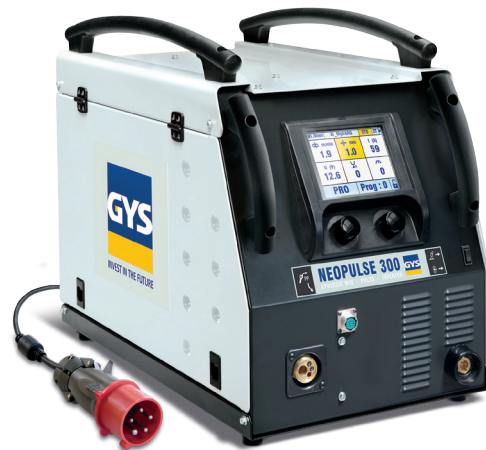
Poste fourni sans accessoires.

Le NEOPULSE détermine les conditions optimales de soudage et permet de les ajuster (vitesse d'avance fil, tension, courant, self).