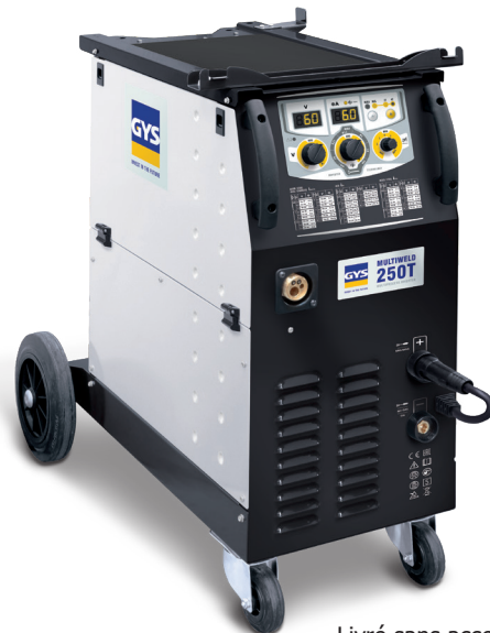
Livré sans accessoires